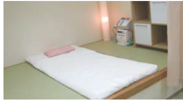
量空間によるバースコーナー。

A: 分娩台を使用しないことで、万一の際に、対応が遅れたり、不十分になったりするのではないかと