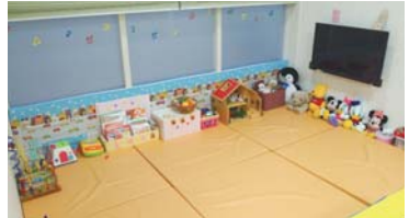
キッズスペースも完備。 広くて子ども達が喜ぶおもちゃもたくさん♪

助産師：前に述べたように、当院ではお産に集中できる体制・環境があるので嬉しいですが、病院では様々な患者さんに対応しながらでしたので、どうしてもお産に集中出来ず、正直ストレスでした。ですが当院ではお産に集中する事が出来ます。集中できる環境な