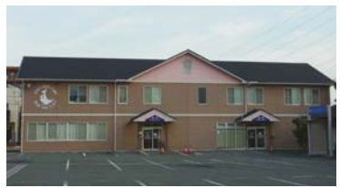
京都府精華町にあるクリニック。 最寄駅は近鉄京東線「新祝園駅」。

気になる「インフルエンザ」について もうすぐインフルエンザが流行する季節です。妊婦さんはインフルエンザにかかると重症化しやすいので積極的にワクチンを受けましょう。