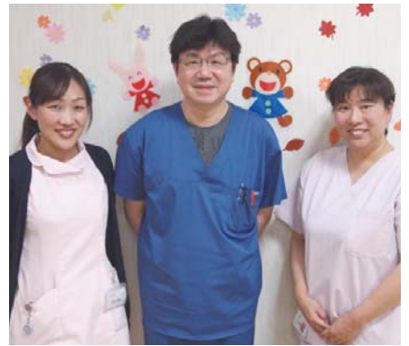
「産む時も、産まれてからも」 当クリニックのスタッフが一丸となって、 お母さんと赤ちゃんを全力でサポートします。